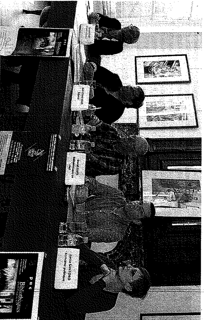
La bibliothèque de Soignies s'est mobilisée pour accueillir un espace écrivain public. ■ ES.

L'écrivain public propose donc un accompagnement à la compréhension et à l'écriture des textes. Il écrit avec la personne bénéficiaire de son service afin de la responsabiliser. Selon les conditions d'existence de chacun, nous ne sommes pas tous égaux face à l'écriture. Loin de là. C'est ici qu'intervient